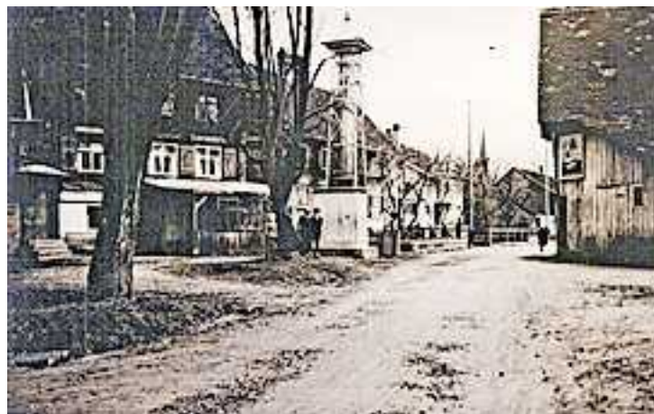
Die Elektrifizierung veränderte das Dorfbild. An einigen Stellen der Gemeinde wurden solche Transformatoren aufgestellt.

Dem technischen Fortschritt wollte und konnte man sich auch in unserer Gemeinde nicht verschließen. Am 10. März 1906 brannte im Dorf erstmals elektrisches Licht.