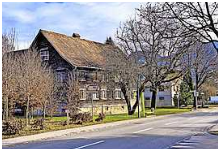
Im Laufe der Jahre hat sich dieser Straßenabschnitt stark verändert

mit elektrischem Strom versorgt. Bereits 1906 gab es Pläne, die Gemeindestraßen elektrisch zu beleuchten. Ein Angebot der Firma Jenny & Schindler war aber offenkundig zu hoch.