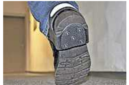
Weitere Infos unter www.sicheresvorarlberg.at