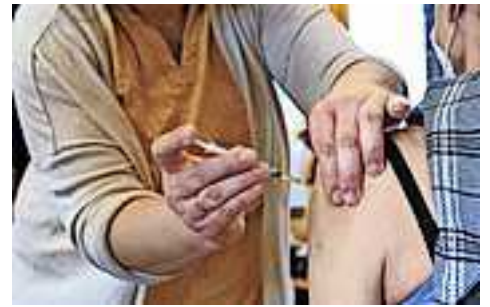
Alle weiteren Infos zur Corona-Schutzimpfung finden Sie unter www.vorarlberg.at/vorarlbergimpft!

Für die Phase 2 könnte die frühere Zulassung von „AstraZeneca“ eine Beschleunigung für weitere priorisierte Berufsgruppen bedeuten, allerdings nur, wenn dann auch ausreichend