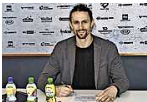
Neven Subotic stand 2013 im Finale der UEFA Champions League

Zum einen nimmt der Verein den international erfahrenen Innenverteidiger Neven Subotic (32) unter Vertrag. Subotic spielte zuletzt beim türkischen Erstligisten Denizlispor und wechselt ablösefrei in die CASHPOINT Arena. Der 36-fache serbische Nationalspieler feierte seine größten Erfolge mit Borussia Dortmund, wo er zwischen 2008 und 2018 zweimal deutscher Meister und Pokalsieger wurde. Außerdem stand er mit dem BVB im UEFA Champions League-Finale 2013.