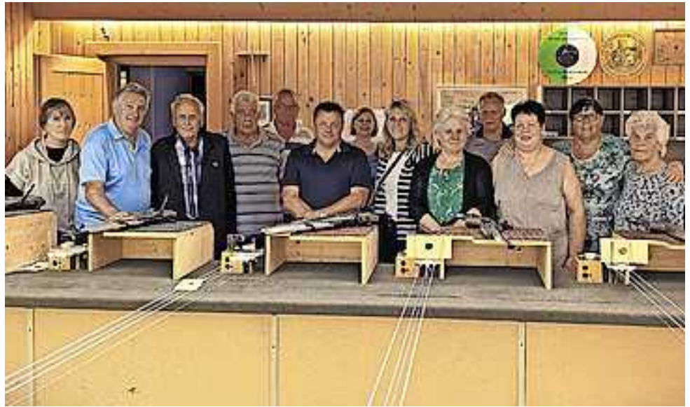
37. Generalversammlung des Krippenvereins Götzis.

Der Obmann berichtete danach über die Einschränkungen durch die Corona-Maßnahmen und, dass im Jahr 2021 die Krippenbaukurse doch wieder durchgeführt werden konnten, die Krippenausstellung aber nicht mehr möglich war. Dafür bedankte er sich beim Lehrerteam und bat um weite-